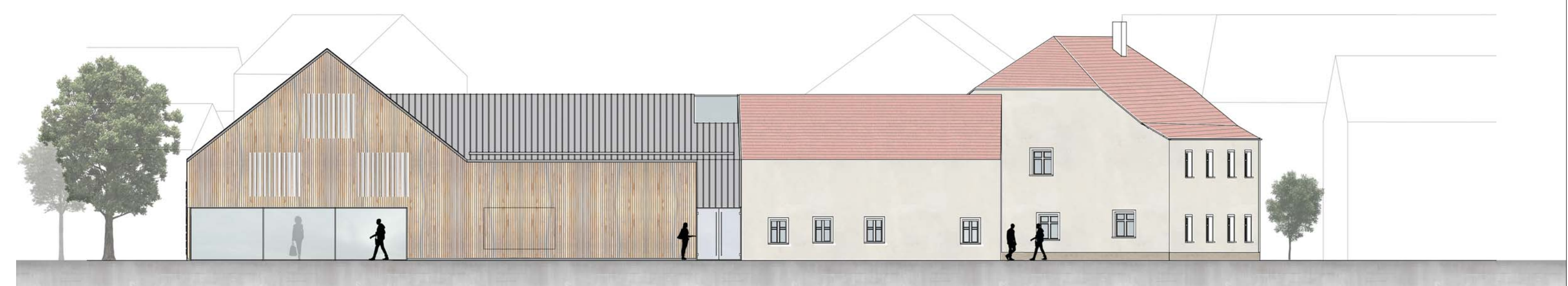
Ansicht Südseite (Bachseite) M 1:200