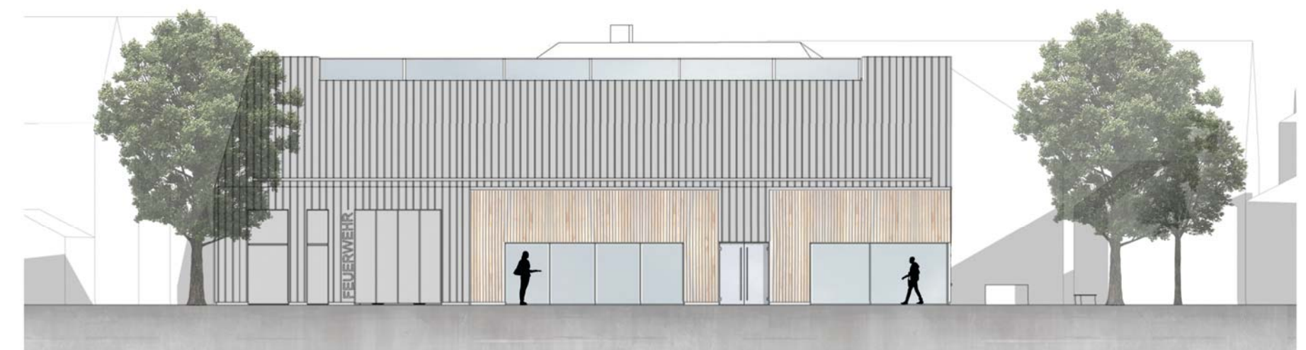
Ansicht Westen (Kirwaplatz, Feuerwehrezufahrt) M 1:200