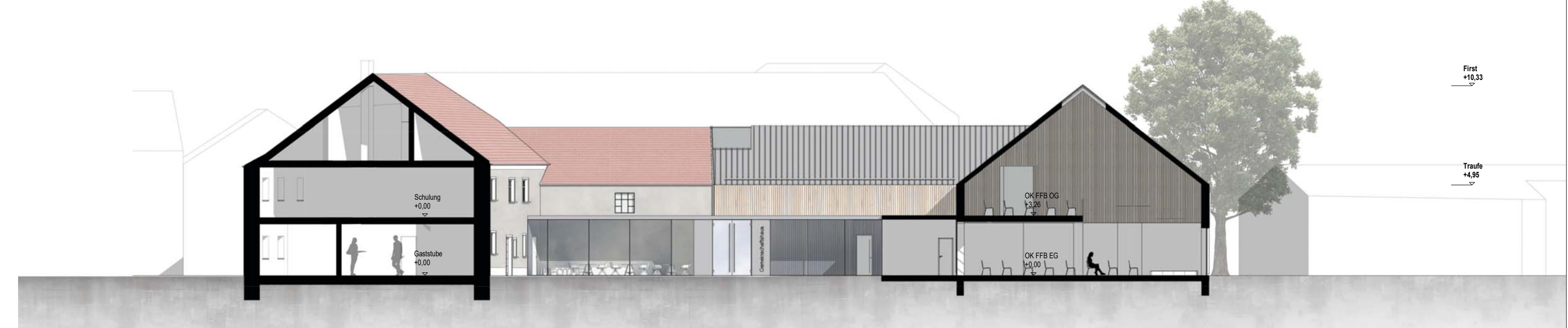
Schnitt S2, Bereich Veranstaltungssaal und Gemeinschaftshaus M 1:200