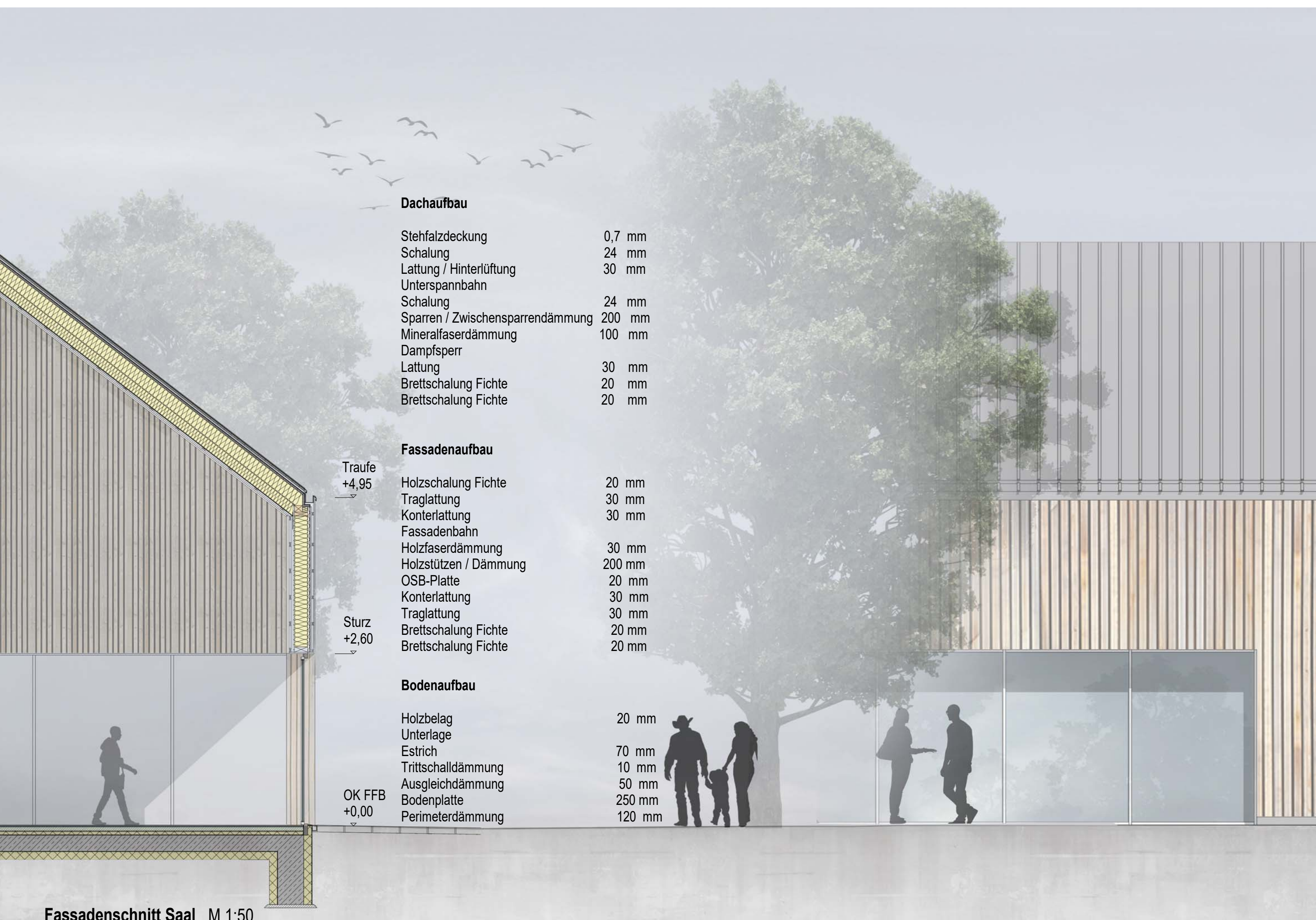
Fassadenschnitt Saal M 1:50