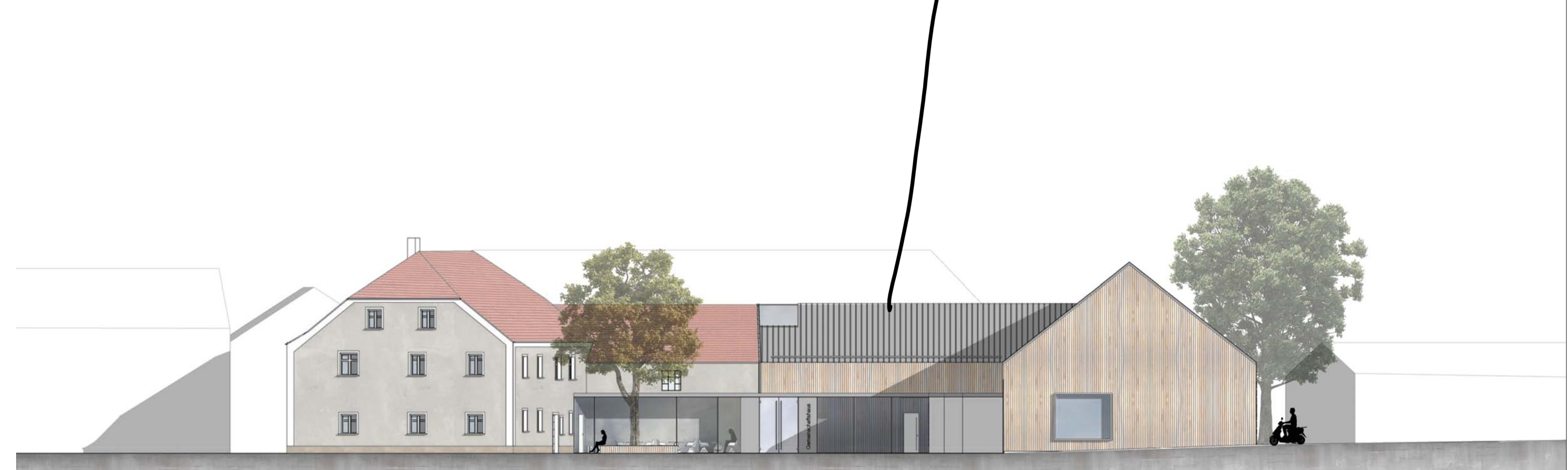
Ansicht Hofseite (Straßenseite) M 1:200