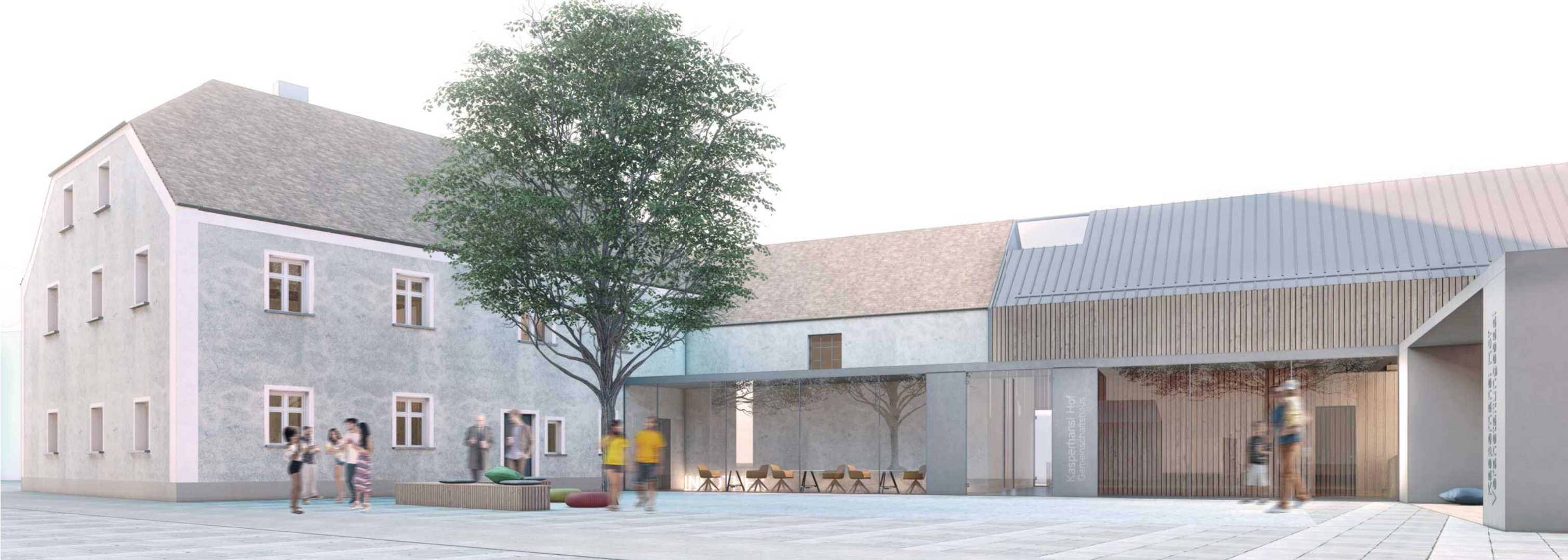
Visualisierung Hofansicht ( Festplatz) unmaßstäblich