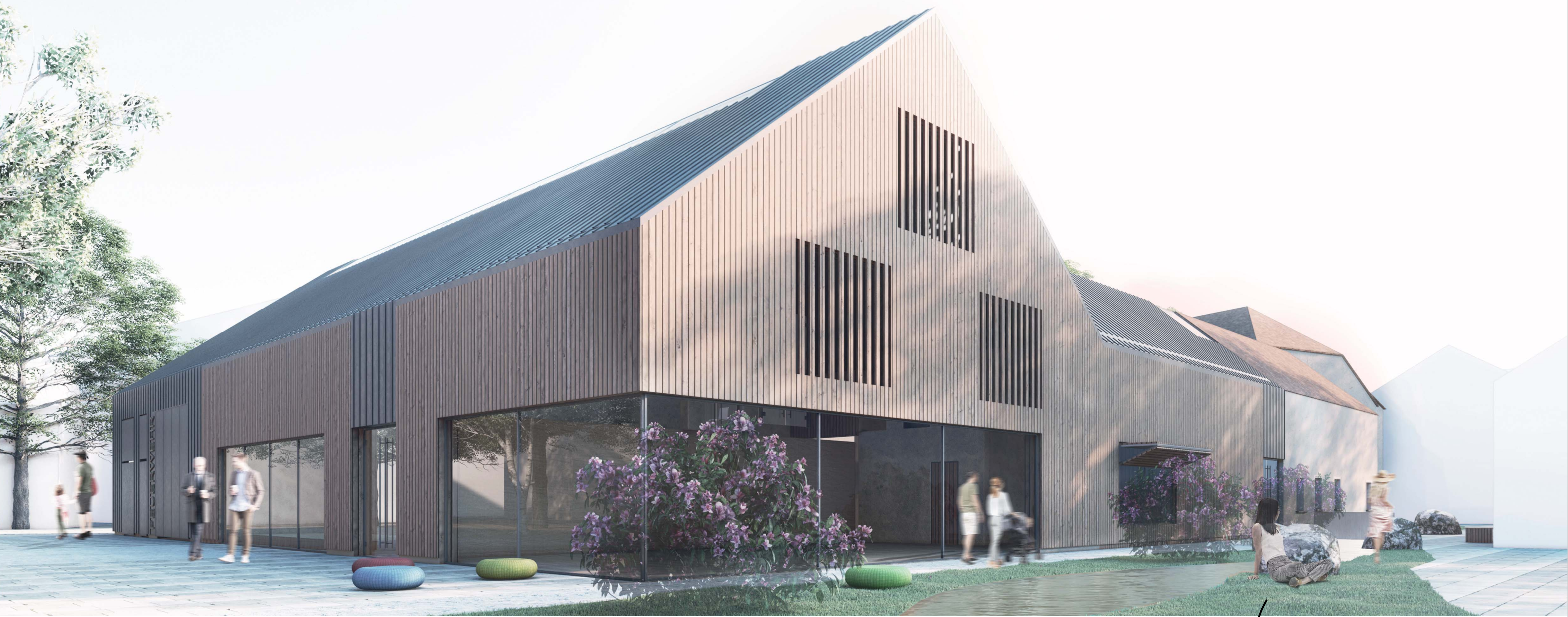
Visualisierung Kirwaplatz maßstabsunabhängig