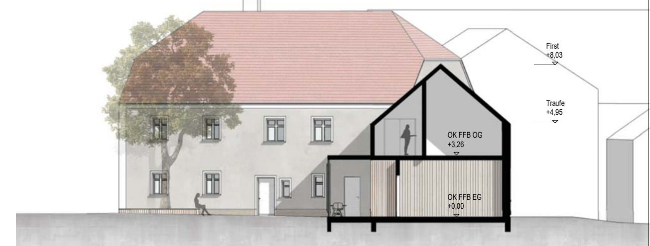
Schnitt S1, Bereich Foyer und Nebenräume M 1:200